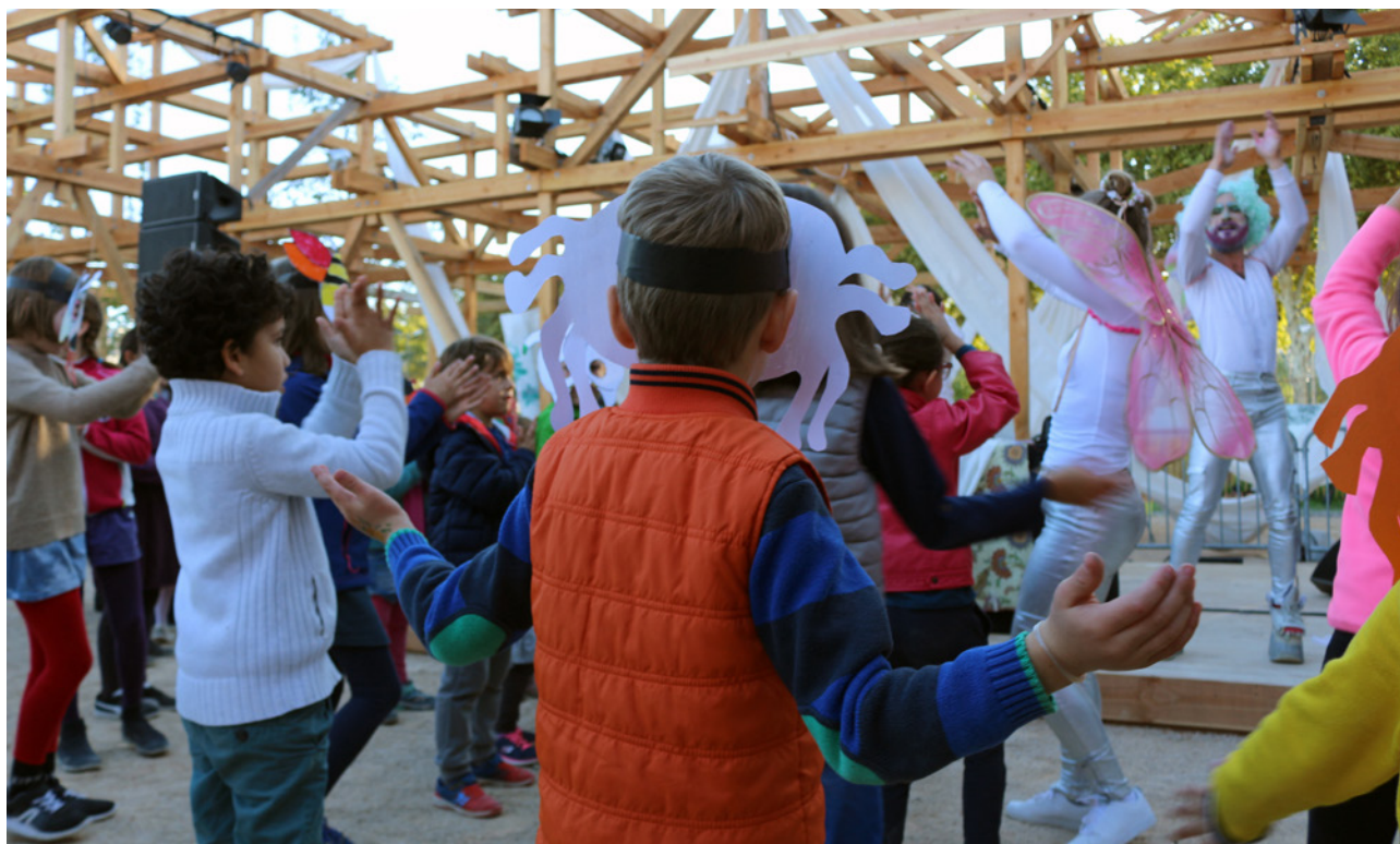
Le Bal des Insectes – Station Mue, Lyon – Octobre 2018

tudansesmonchou vous aime et vous fait danser